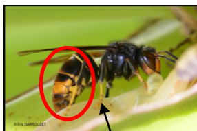
Extrémité des pattes de couleur jaune